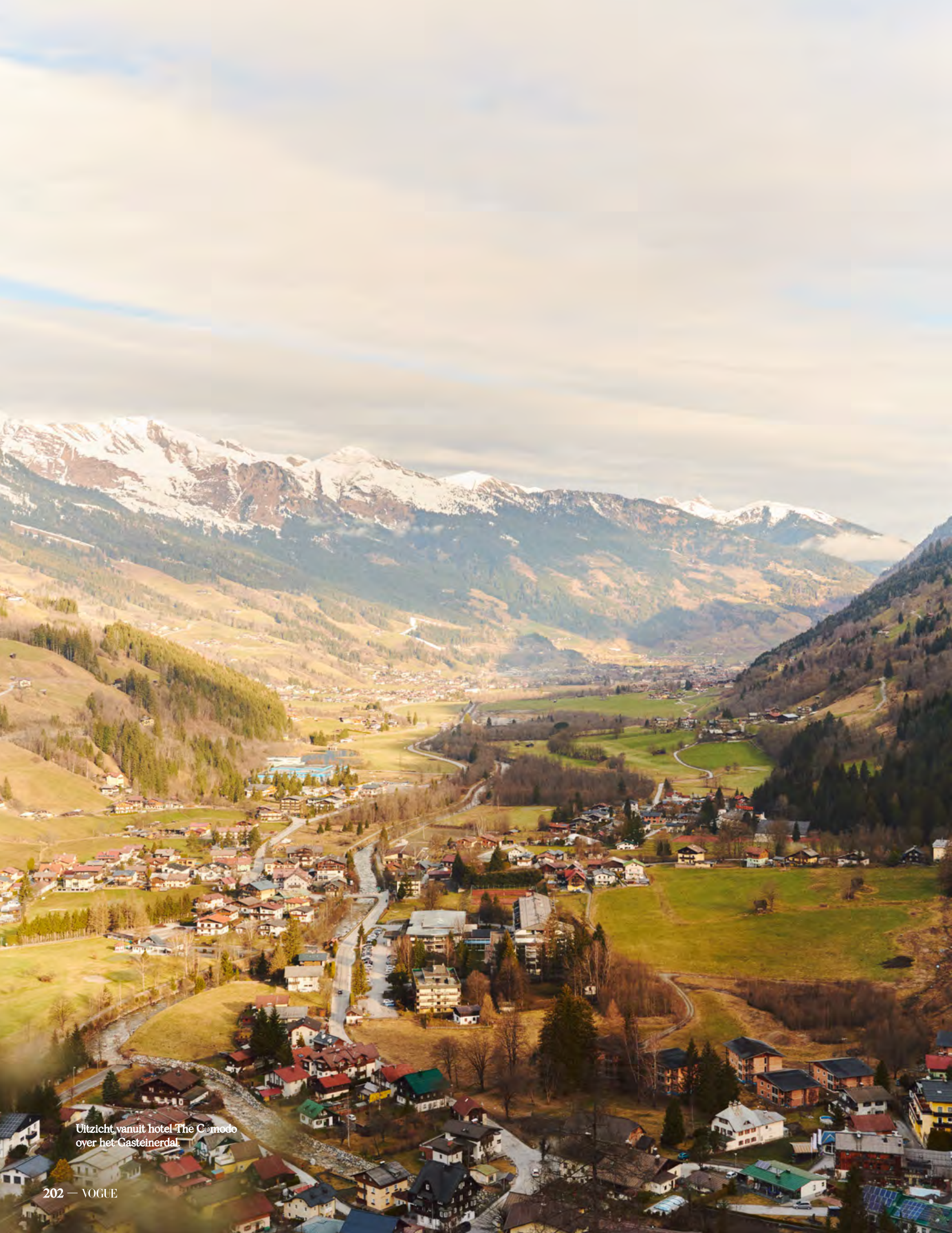
Uitzicht vanuit hotel The Comodo over het Gasteinerdal