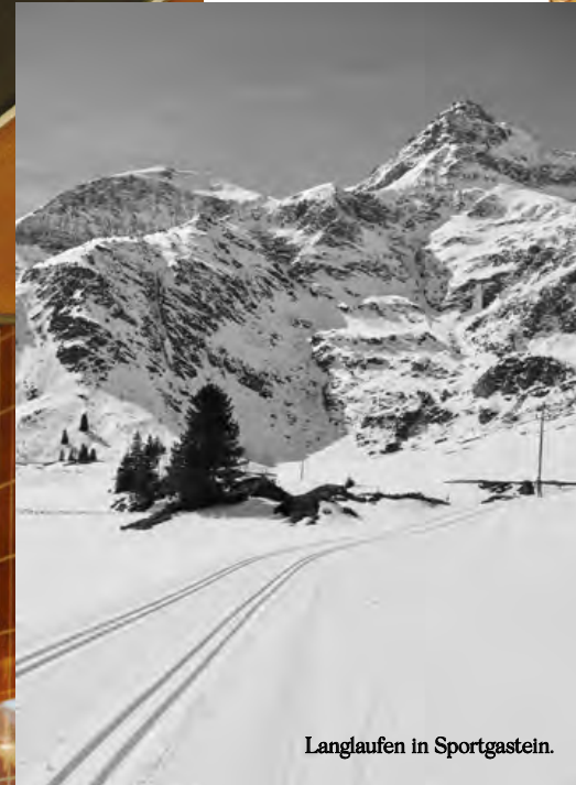
Langlaufen in Sportgastein.

Met hout en een warm kleurenpalet kreeg de voormalige jarenzestiguur-kliniek een eigentijdse update.