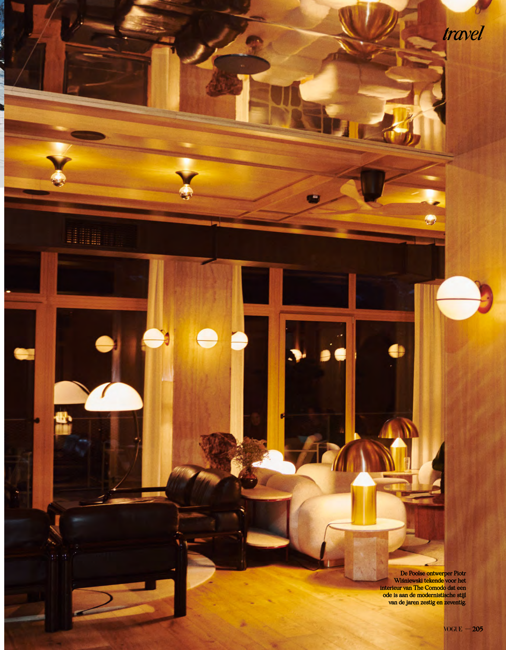
De Poolse ontwerper Piotr Wiśniewski tekende voor het interieur van The Comodo dat een ode is aan de modernistische stijl van de jaren zestig en zeventig.

Elwardt en haar team hebben zich laten inspireren door het verhaal van de locatie zelf. Wellness zit diep in het DNA van deze plek, dus is er veel aandacht besteed aan de sparuimte, en het zwembad heeft misschien wel het meest spectaculaire >