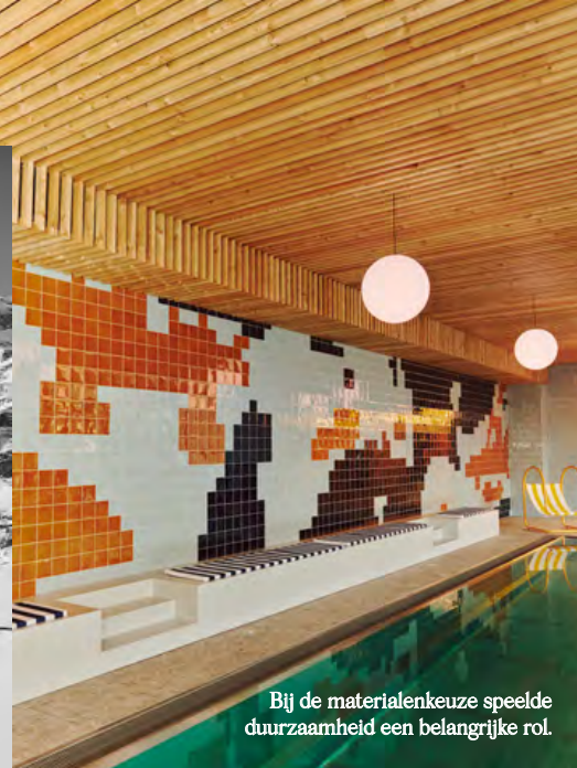
Bij de materialenkeuze speelde duurzaamheid een belangrijke rol.