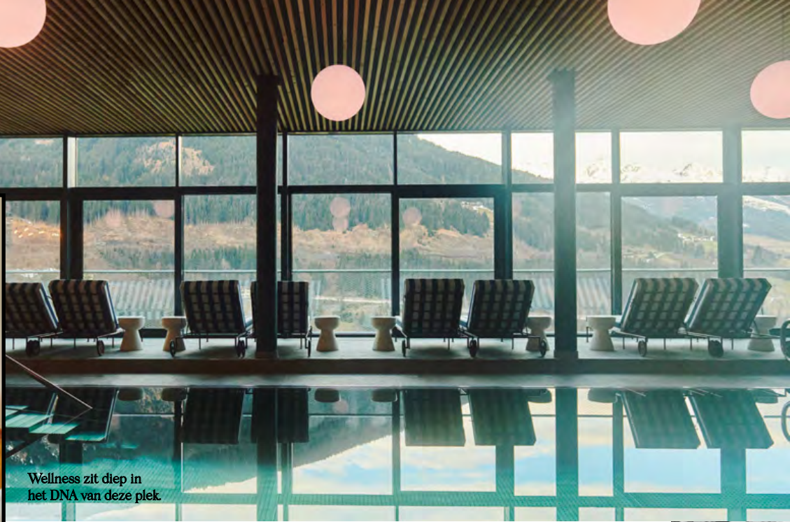
Wellness zit diep in het DNA van deze plek.