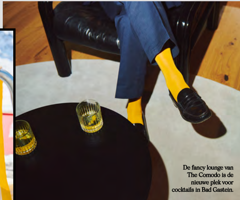
De fancy lounge van The Comodo is de nieuwe plek voor cocktails in Bad Gastein.