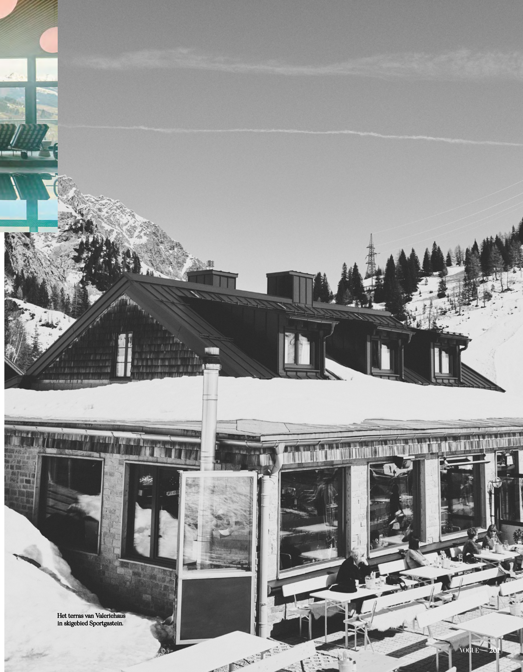
Het terras van Valeriehaus in skigebied Sportgastein.

Als ik even later mijn rolkoffer over de Kaiser Wilhelm Promenade trek, voel ik hoe er een nieuwe energie door het dal stroomt, ongrijpbaar maar onweerstaanbaar en onmiskenbaar. Ik kan haar bijna aanraken. De voortekenen waren me tijdens de >