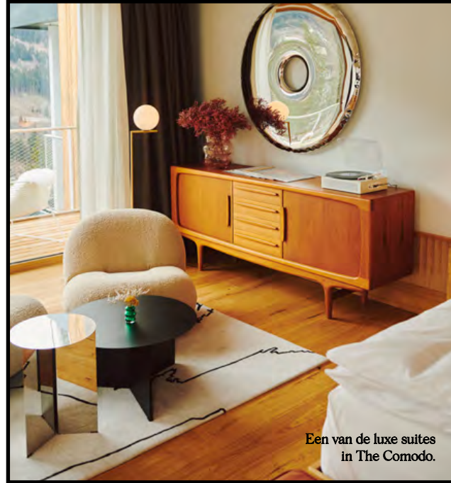
Een van de luxe suites in The Comodo.