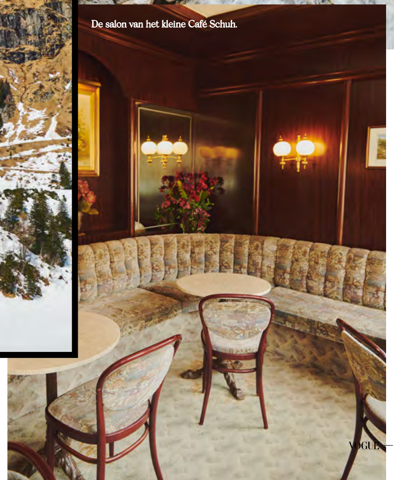
De salon van het kleine Café Schuh.