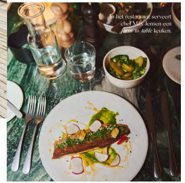
In het restaurant serveert chef Max Jensen een farm-to-table keuken.

B ad Gastein eind jaren negentig. Een spookdorp op 1002 meter hoogte in de Oostenrijkse Alpen. Het spook dat de meeste aandacht trekt, is het megalomane Grand Hotel de l'Europe, dat prominent boven aan een klif staat. Het zit potdicht en ook in de hoofdstraat kun je een kanon afschieten. De enigen die je daarbij per ongeluk zou kunnen raken, is een groep Russische toeristen die selfies maakt voor de waterval. Die waterval is de levensader van het dorp. De machtige stroom dendert naar beneden en stort vijf miljoen liter water per dag in de Elisabethquelle. Dat gaat gepaard met een oorverdovend geweld. In Bad Gastein hoor je het water altijd en overal.