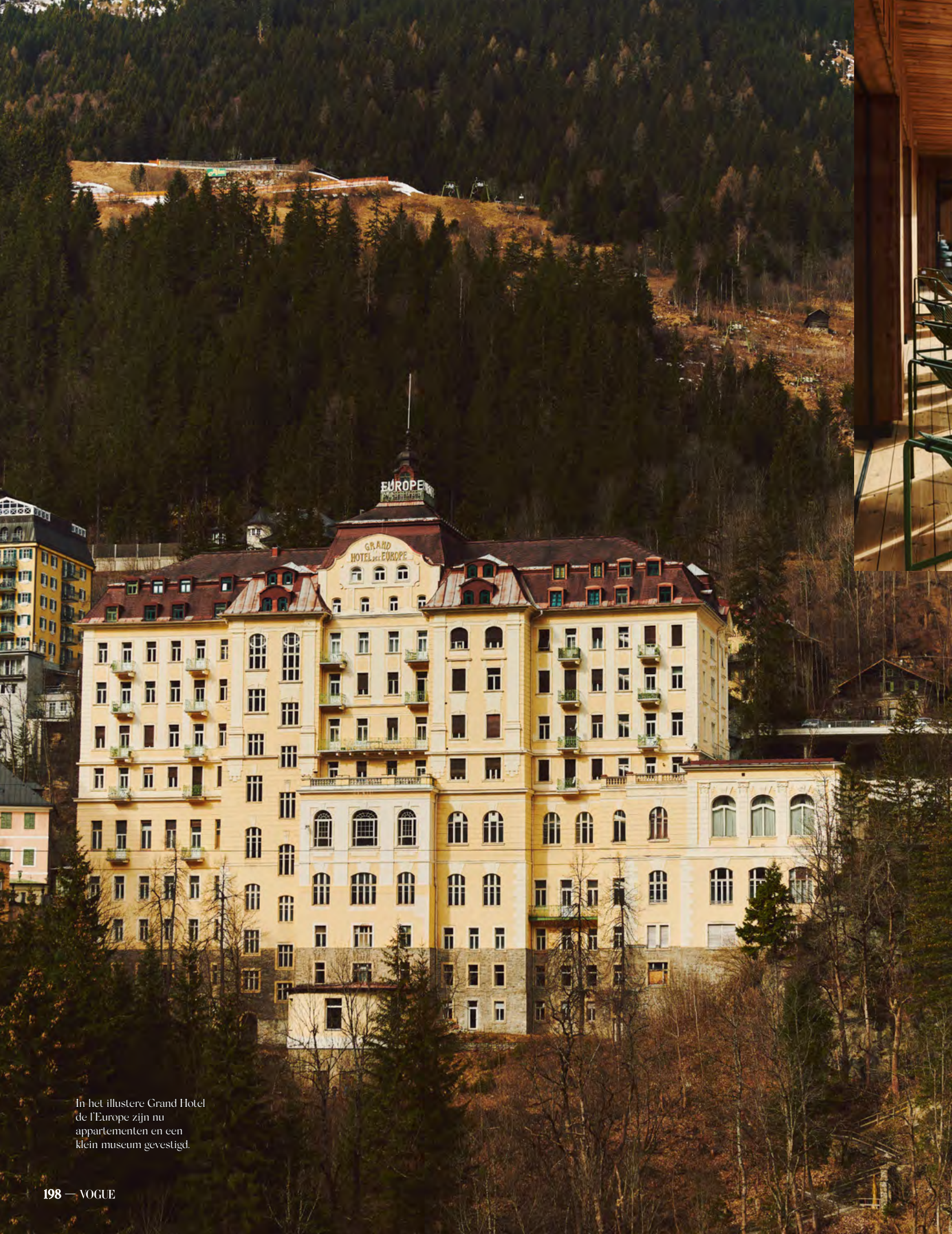
In het illustere Grand Hotel de l'Europe zijn nu appartementen en een klein museum gevestigd.