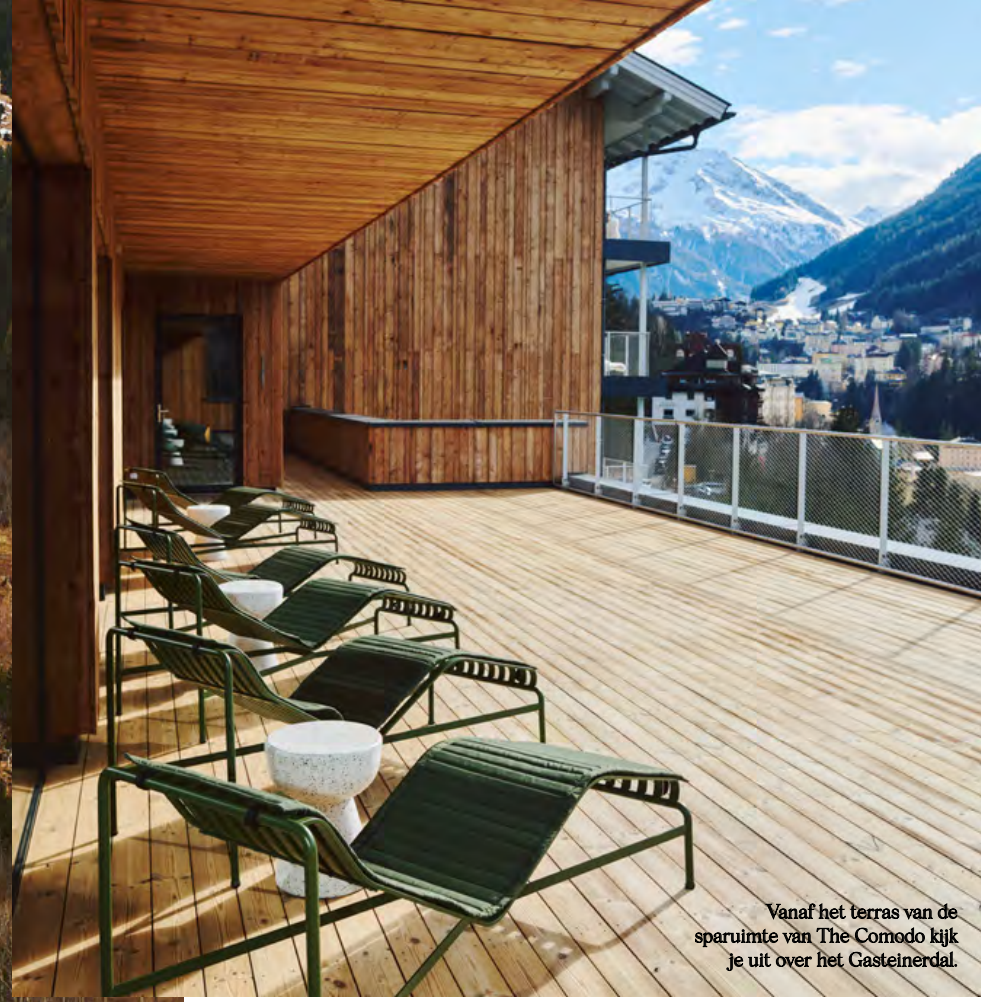
Vanaf het terras van de sparuimte van The Comodo kijk je uit over het Gasteinerdal.